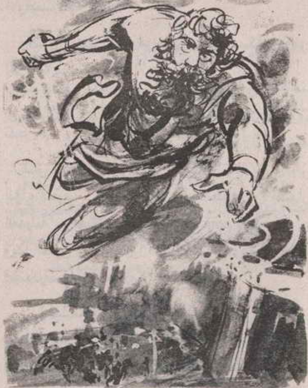
ورآه المتحاربون يهبط من السماء محاطًا بالغيوم ، فارتاعت قلوبهم وارتعدت فرائصهم ..

- « ( زيوس ) نفسه يحارب مع الطرواديين ! ومن لنا بمواجهة ( زيوس ) !؟ »